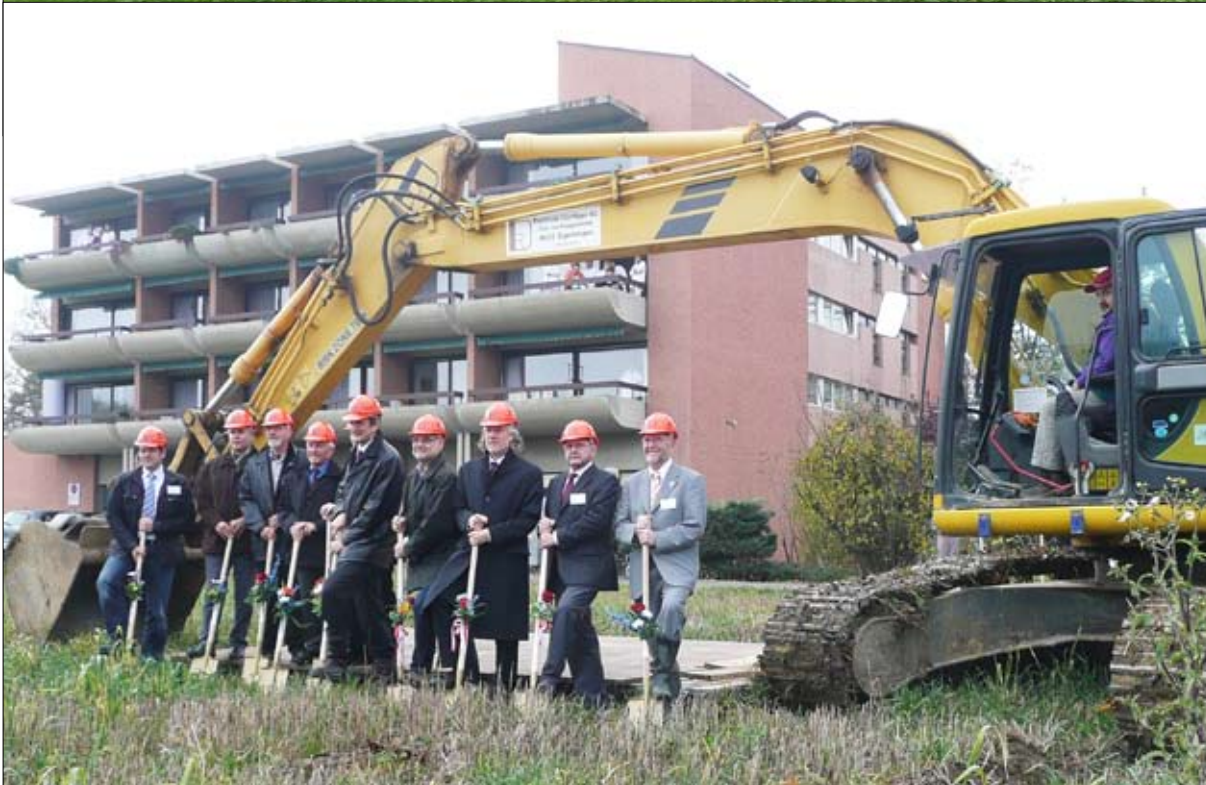
Spatenstich Freitag, 13. November 2009